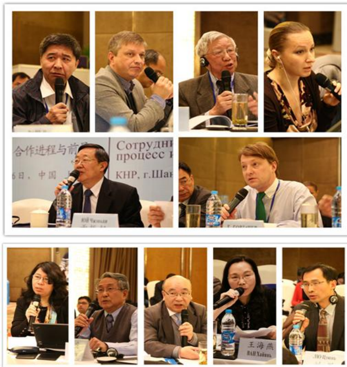
参与第四阶段发言与讨论的代表们

“丝绸之路经济带”与欧亚经济联盟之间的对接，是本次会议的一个重要议题。有中国学者认为，上海合作组织应该成为实现欧亚经济联盟与“丝绸之路经济带”对接的平台。也有学者指出，对接重在具体化，否则会流于概念和口号，产业对接和“五通”是主要的对接领域。有俄罗斯学者指出，欧亚经济联盟与中国“一带一路”战略合作关系的建立避免了双方在中亚地区的竞争。