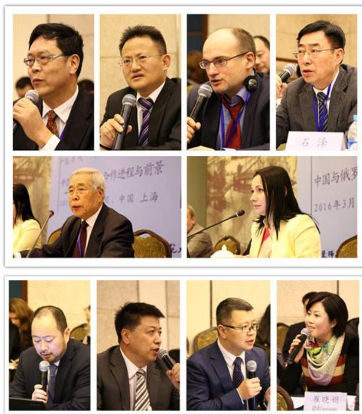
参与第一阶段发言和讨论的代表们

就中俄在双边层面的合作现状及评价。与会专家认为，双方在政治、安全、经贸、人文、地区合作等领域的合作，都表明中俄关系不断走向成熟。目前及未来摆在中俄双方面前的主要任务是，如何保持两国关系的高水平运行。为此，中俄双方专家学者应该认真研究存在的问题，提出解决办法，为两国的决策部门提供智力支持。关于中俄关系的未来，有中国学者认为，中俄关系应包容性发展，即立足于共同点和共同利益，同时包容差异和不同点；中俄应在经济合作方面下定战略性决心，真正把对方作为长期、全面、战略性的伙伴来定位和经营。