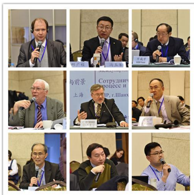
参与第三阶段发言与讨论的代表们