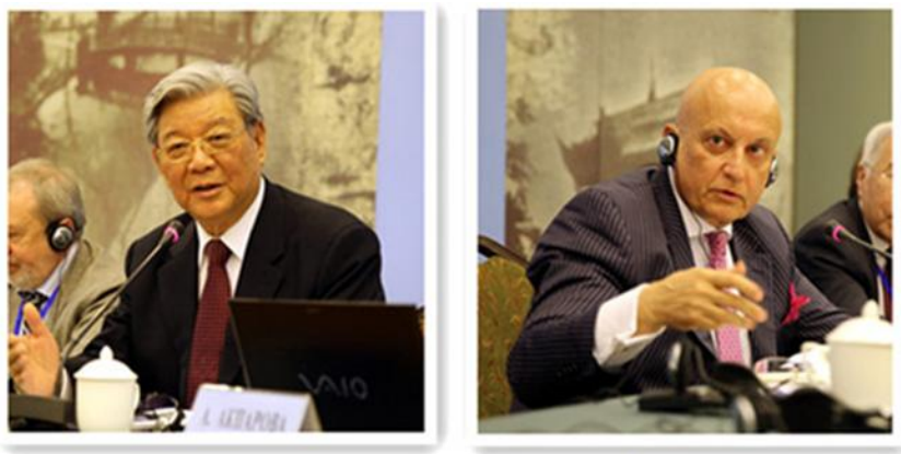
张德广秘书长与卡拉加诺夫主席做主旨发言

张德广大使表示，中俄关系从 1992 年的“建设性伙伴关系”、1996 年的“战略协作伙伴关系”，到今天的“全面战略协作伙伴关系”，两国关系一直朝着“睦邻友好，互不为敌”的方向发展。中俄政府间互动积极，往来频繁，但两国民众之间缺乏密切的联系和沟通，民间贸易更是中俄关系的短板。中俄两国学者、媒体人应该承担起正确引导新闻动态的责任，拉近中俄人民的联系。“一带一路”和欧亚经济联盟之间的对接将覆盖欧亚大陆，中俄双方应该协调合作，加强“中亚是中俄共同战略利益区”的战略共识。卡拉加诺夫教授在发言中提出了几大重要的全球发展趋势。21 世纪国际社会发展的一个明显趋势是西方实力下降和全球实力分配变化。从冷战的“三极”格局，到当今的多极态势，以美国为首的“超国家经