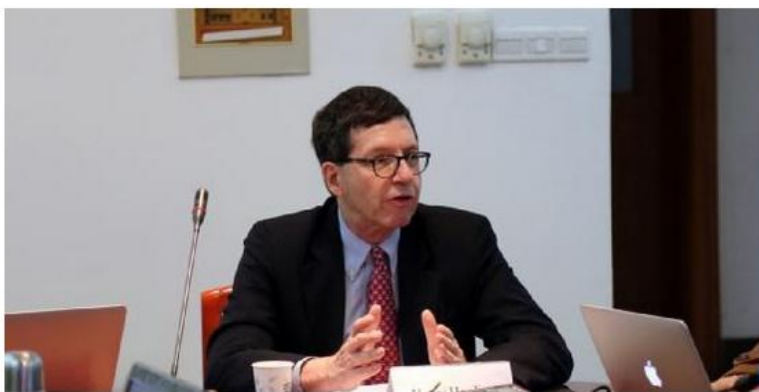
哈里·哈丁教授作主旨演讲

2016年3月2日，亚洲事务专家、弗吉尼亚大学政治学教授哈里·哈丁到访华东师范大学国际关系与地区发展研究院、俄罗斯研究中心，并为学院师生带来了题为“美国对华政策失败了吗？”的演讲。白永辉教授主持本次讲座。