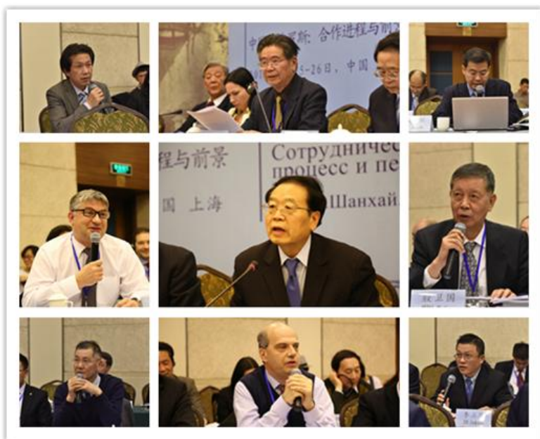
参与第二阶段发言和讨论的代表们

关于全球与地区安全挑战，有中国学者指出，中俄对当前国际安全形势的看法在许多方面是相近的，都认为当今世界正在发生深刻复杂的变化，世界多极化深入发展，国际战略格局加快分化组合，大国战略博弈更加激烈。国际恐怖主义、金融动荡、贸易保护主义等，都有不断加剧的趋势。东亚、南海、中东、阿富汗、欧洲等地区，都存在着传统的安全困境。有俄罗斯学者认为，全球治理难以实施，也使得武力的使用又一次成为重要选项。这意味着，军事力量在国际事务中的地位可能还会上升，对国际法权威的破坏也推动了这一趋势。