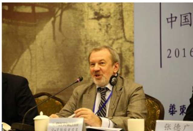
贝斯特里茨基先生在大会中致辞

促进两国专家学者的相互理解和信任。他还重点介绍了中俄两国在高层交流、经济合作、文化交流、国际协作等方面取得的成绩和进一步的合作安排。