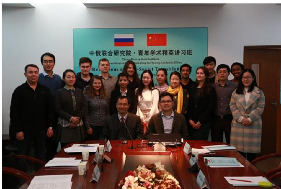
中俄联合研究院第三届青年学术精英讲习班开幕式合影