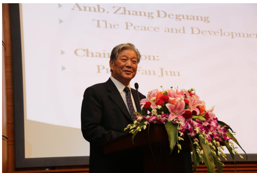
上海合作组织首任秘书长、中国驻俄罗斯前大使张德广应邀为大会做主旨演讲

中国俄罗斯、东亚和中亚研究协会会长李永全教授在致辞中表示，欧亚地区在世界格局中扮演着非常独特的角色，最近二三十年来世界形势的发展和欧亚地区的变化有密切的关系。