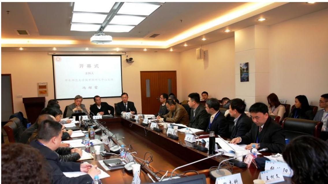
中俄“两河流域”合作工作会议

“十三五”基地重大项目《中俄经贸合作的理论与实践模式研究——基于对两国毗邻、非毗邻地区和支点城市的企业合作调研》于 2016 年年底立项。对于该项目，教育部社科司专家的回馈意见均肯定该项目的务实性，有很大的现实需求。2017 年 3 月 25 日，以该项目为依托，举行了中俄两河流域智库论坛。邀请国内相关身份的实务部门、企事业单位的代表出席会议，听取各方面的意见。2017 年 6-7 月，项目组成员计划赴俄罗斯伏尔加河联邦区进行实地调研。外交部欧亚司司长桂从友同志全程参加本次智库论坛，并对项目的下一步工作，提出了具体的指导意见。