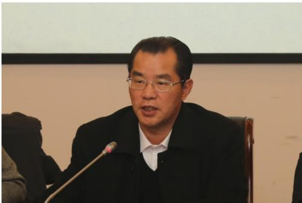
外交部欧亚司司长桂从友发言

桂从友司长就“两河流域”机制倡议的提出与建立进行了简要介绍。他建议智库专家的研究围绕以下三个方面展开：第一，在政治层面，需要更多地总结两地区地方发展经验，开展深入交流；第二，对俄方 14 个联邦主体的市场经济发育程度进行深入了解，包括地方的法规和经济管理模式，为中国企业家与俄方开展合作提供指导；第三，研究中国长江中上游地区 6 省市和俄罗斯 14 个联邦主体之间在产业结构和产能等方面的互补性。